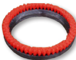
Щеточное кольцо под заказ