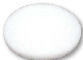
Белый пад (диаметр 33 см)