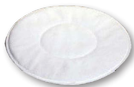
Пад из микрофибры (диаметр 33 см) под заказ