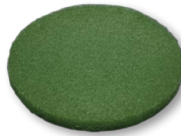
Зеленый пад (диаметр 33 см)