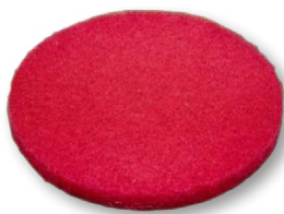
Красный пад (диаметр 33 см)